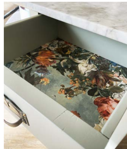
▲ Die mit Tapete ausgelegte Schublade.