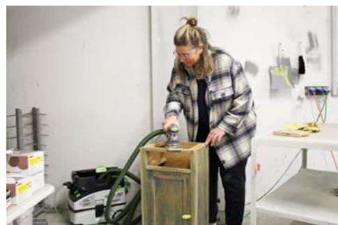
◀ Die alte Lasur muss weg, bevor die neue Farbe aufgetragen werden kann.