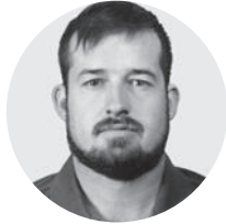
Hager Nicca Bauvorarbeiter mit eidg. FA GLB Emmental